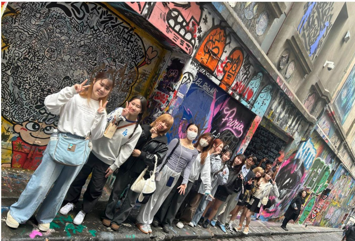
ホイザーレーン 芸術