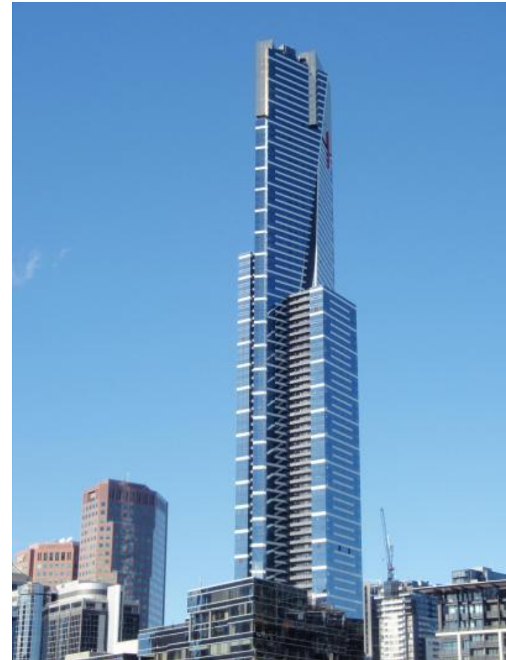
ユーレカスカイデッキ