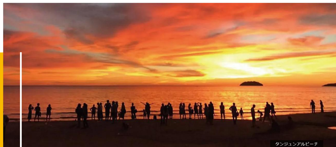
タンジュンアルビーチ