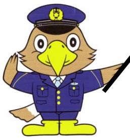
石川県警マスコットキャラクター いぬわし君